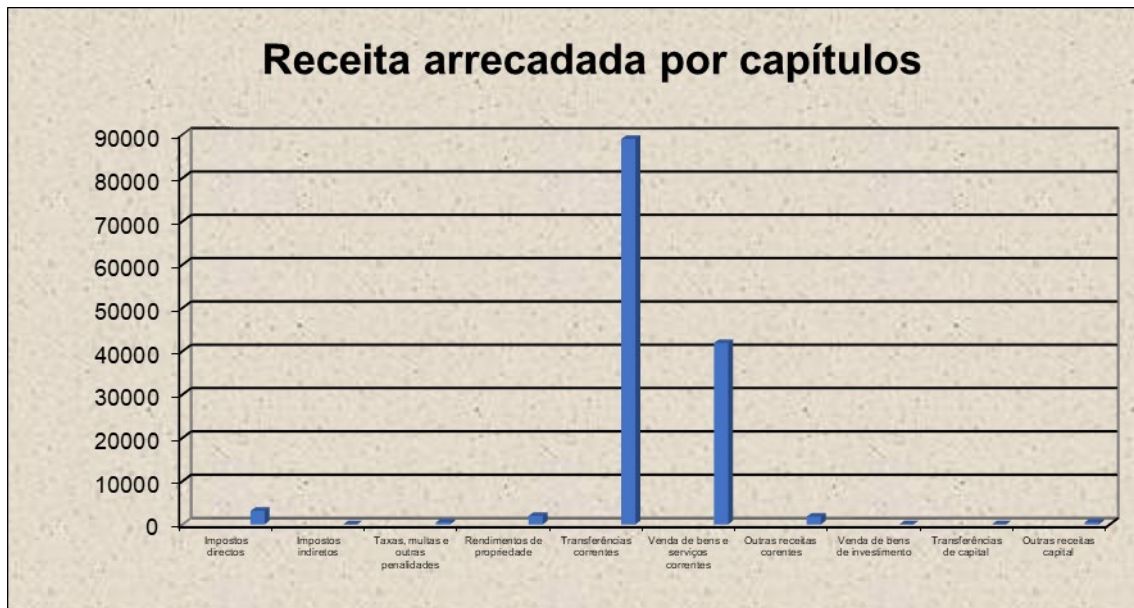
Gráfico n.º 1