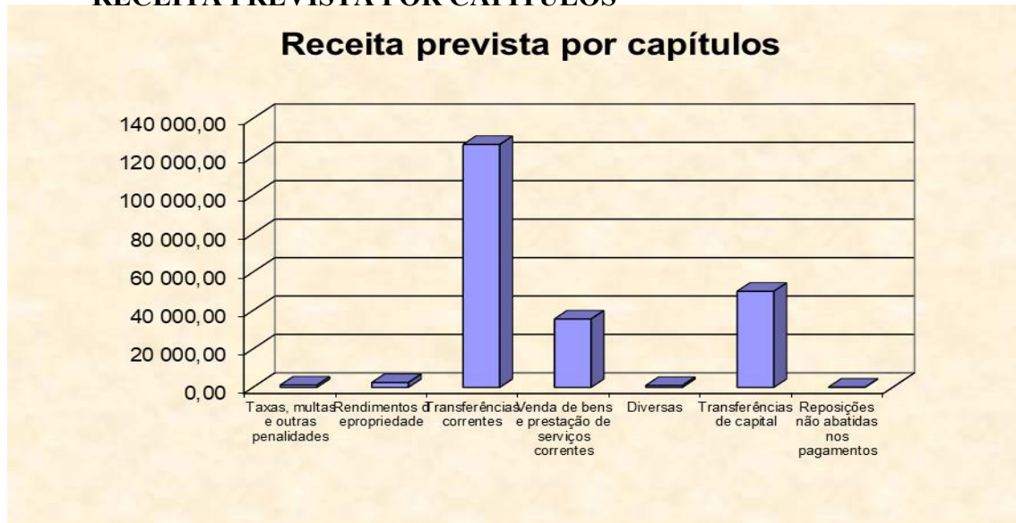
Gráfico n.º 1- receita prevista por capítulos